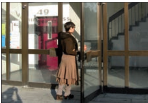
Das Beratungszentrum Jugend und Familie Möhringen

Herausgeberin: Landeshauptstadt Stuttgart, Jugendamt in Zusammenarbeit mit der Abteilung Kommunikation; Gestaltung: Sabine Bothner, Peter Schott; Karte: © Landeshauptstadt Stuttgart, Stadtmessungsamt