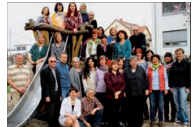
Das Team des Beratungszentrums Jugend und Familie Möhringen