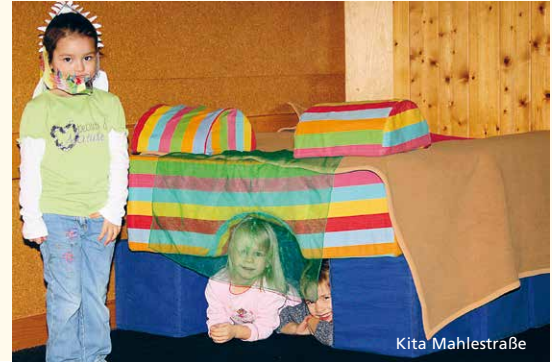
Kinder lernen „spielend“ sprechen.

Kinder sprechen beim Spielen, auch wenn sie alleine spielen. Dabei üben sie Worte und Begriffe, die sie gehört haben.