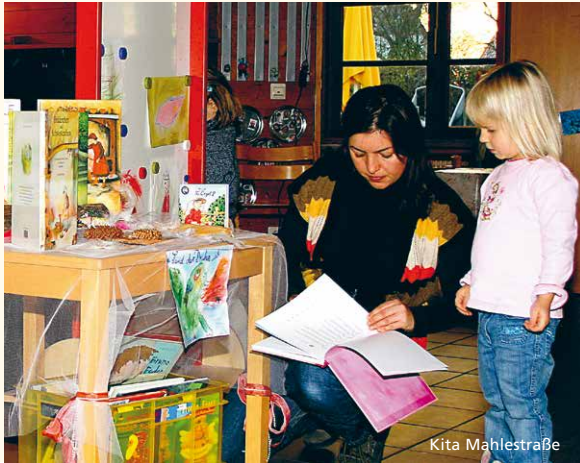
Etwa mit drei bis vier Jahren beginnt das zweite Fragealter.

Fragen Sie die Fachkräfte in Ihrer Tageseinrichtung nach geeigneter Literatur, die Sie dort auch ausleihen können oder besuchen Sie Ihre Stadtteilbücherei. Manchmal findet man auf Kinderbasaren oder Flohmärkten günstige und gute Kinderbücher. Kinder wollen in dieser Phase alles genau wissen. Das ist oft anstrengend für Erwachsene. Wenn die Fragen Ihres Kindes Ihnen zu viel werden, drehen Sie den Spieß einfach herum und fragen selbst: „Was meinst Du...?“