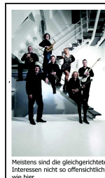
Meistens sind die gleichgerichteten Interessen nicht so offensichtlich, wie hier.